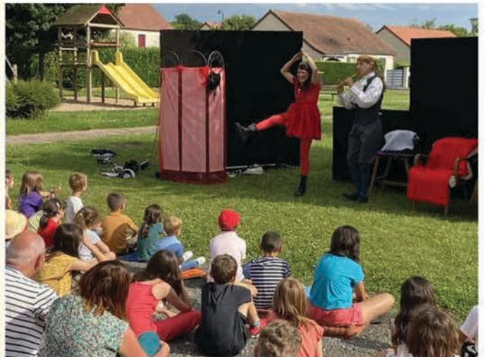
La princesse facétieuse et son père le roi, tiennent en haleine un public ravi de les voir gesticuler de facéties en facéties... Mais va t-elle se marier ?