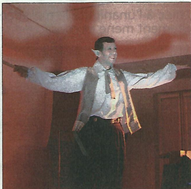
Le lutin Tom Tom connaît des histoires bien mystérieuses.