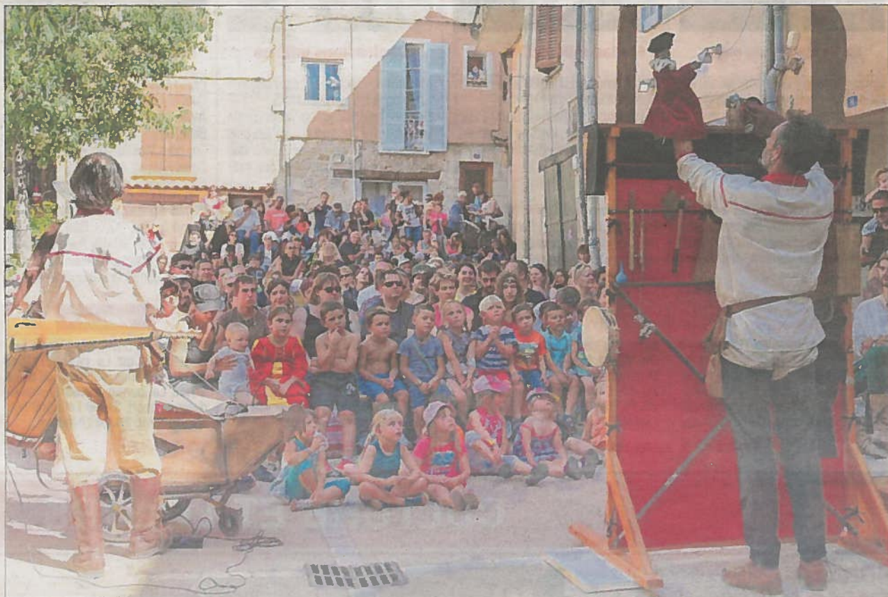
Les enfants très attentifs devant ce spectacle de marionnettes au son des instruments d'antan. Une multitude d'animations qui continuent aujourd'hui encore.

Pourtant les Médiévales n'avaient pas encore dévoilé tous leurs secrets. Et c'est hier que l'ambiance festive s'est emparée des visiteurs et les a emmenés dans le dédale du centre ancien, où le décor naturel des rues suffit déjà à les faire voyager à l'épo-